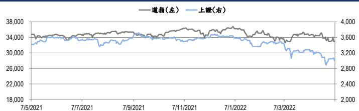
圖一：道瓊工業平均指數及上證綜合指數的一年期變化