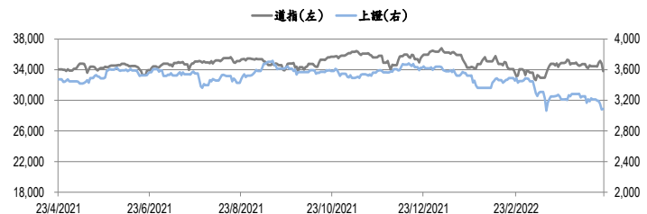
圖一：道瓊工業平均指數及上證綜合指數的一年期變化