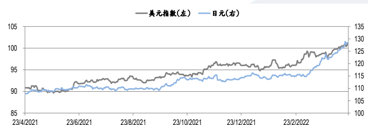
圖三：美元指數及美元/日元的一年期變化