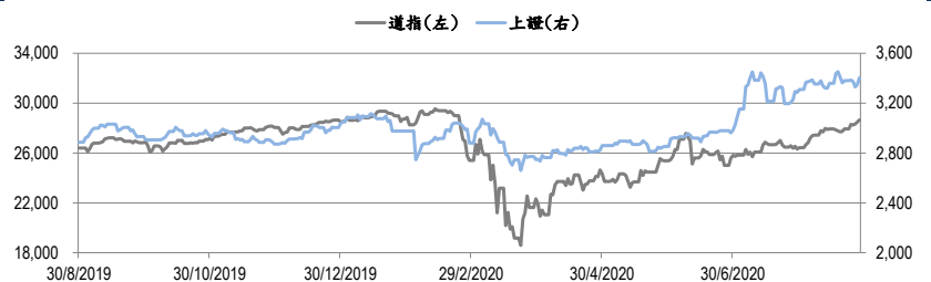
圖一：道瓊工業平均指數及上證綜合指數的一年期變化