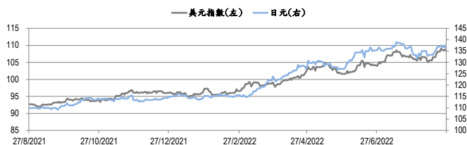
圖三：美元指數及美元/日元的一年期變化