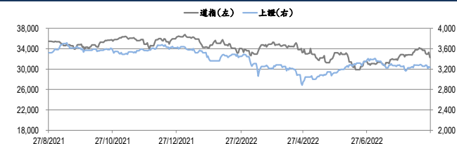
圖一：道瓊工業平均指數及上證綜合指數的一年期變化