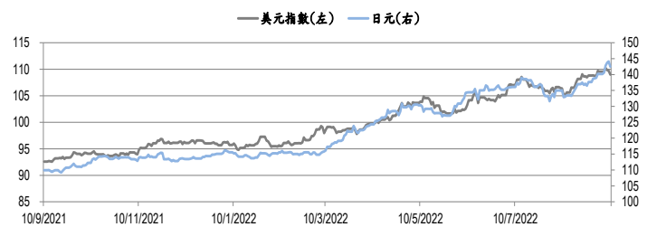
圖三：美元指數及美元/日元的年一期變化