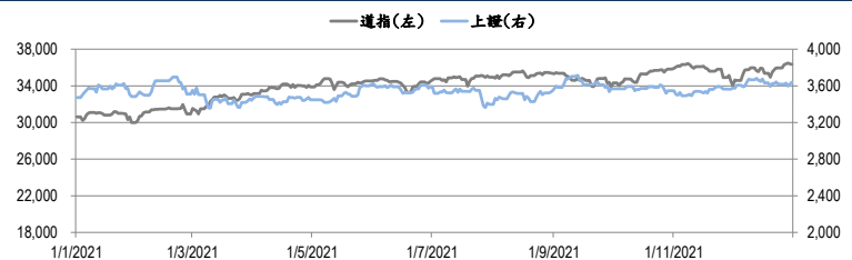
圖一：道瓊工業平均指數及上證綜合指數的一年期變化