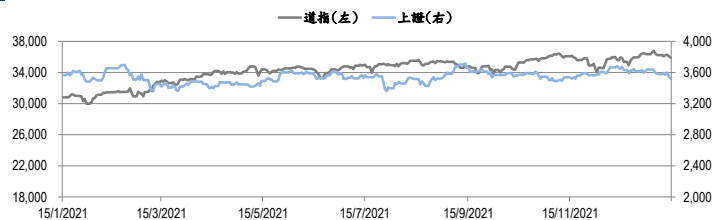
圖一：道瓊工業平均指數及上證綜合指數的一年期變化