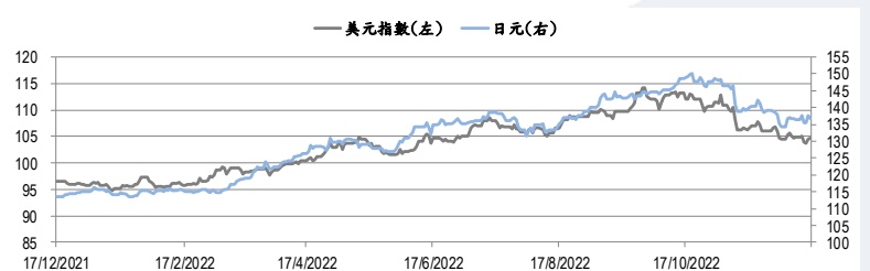
圖三：美元指數及美元/日元的一年期變化