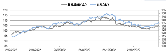
圖三：美元指數及美元/日元的一年期變化