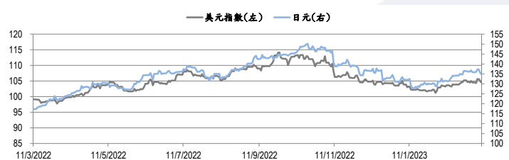
圖三：美元指數及美元/日元的年一期變化