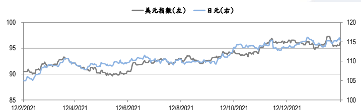
圖三：美元指數及美元/日元的一年期變化