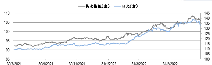
圖三：美元指數及美元/日元的一年期變化