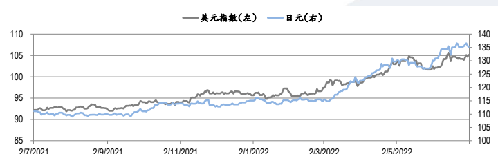
圖三：美元指數及美元/日元的年一期變化