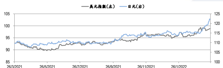
圖三：美元指數及美元/日元的一年期變化