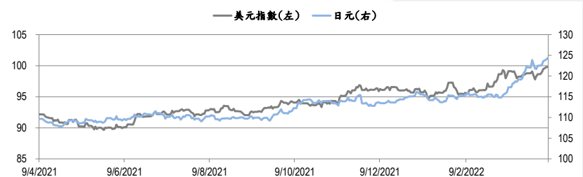
圖三：美元指數及美元/日元的年一期變化