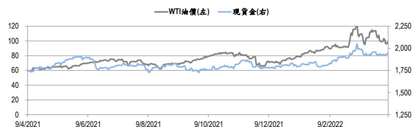
圖二：WTI 原油期貨及現貨金的一年期變化