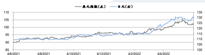
圖三：美元指數及美元/日元的年一期變化