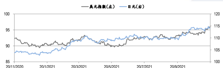
圖三：美元指數及美元/日元的年一期變化