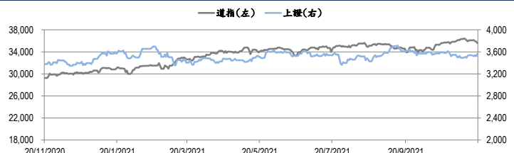
圖一：道瓊工業平均指數及上證綜合指數的一年期變化