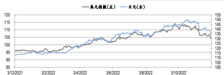
圖三：美元指數及美元/日元的一年期變化