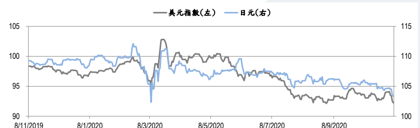
圖三：美元指數及美元/日元的一年期變化