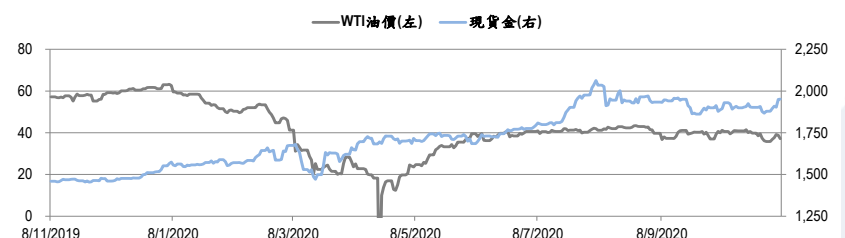
圖二：WTI 原油期貨及現貨金的一年期變化