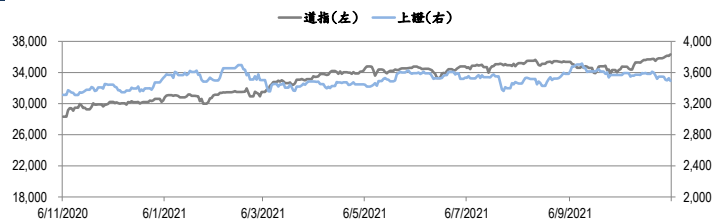
圖一：道瓊工業平均指數及上證綜合指數的一年期變化