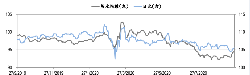
圖三：美元指數及美元/日元的一年期變化