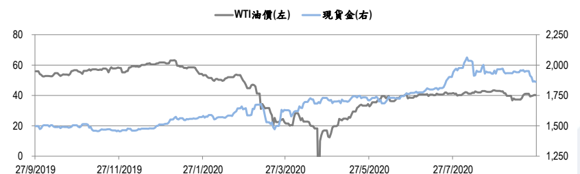
圖二：WTI 原油期貨及現貨金的一年期變化