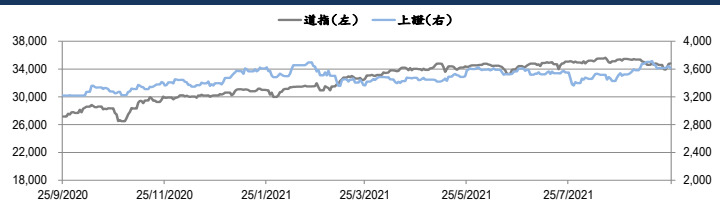
圖一：道瓊工業平均指數及上證綜合指數的一年期變化