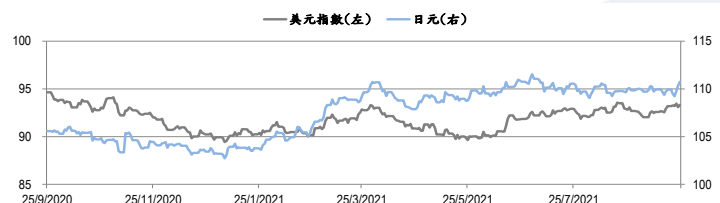
圖三：美元指數及美元/日元的年一期變化