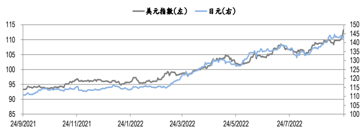
圖三：美元指數及美元/日元的一年期變化